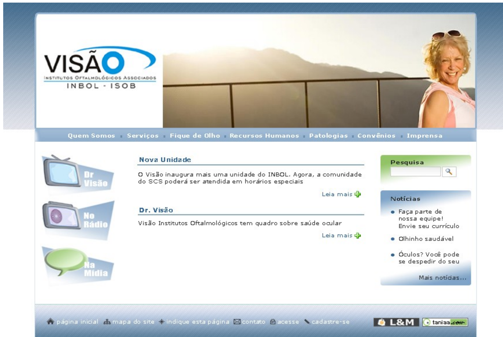
Figura 3 - Layout proposto